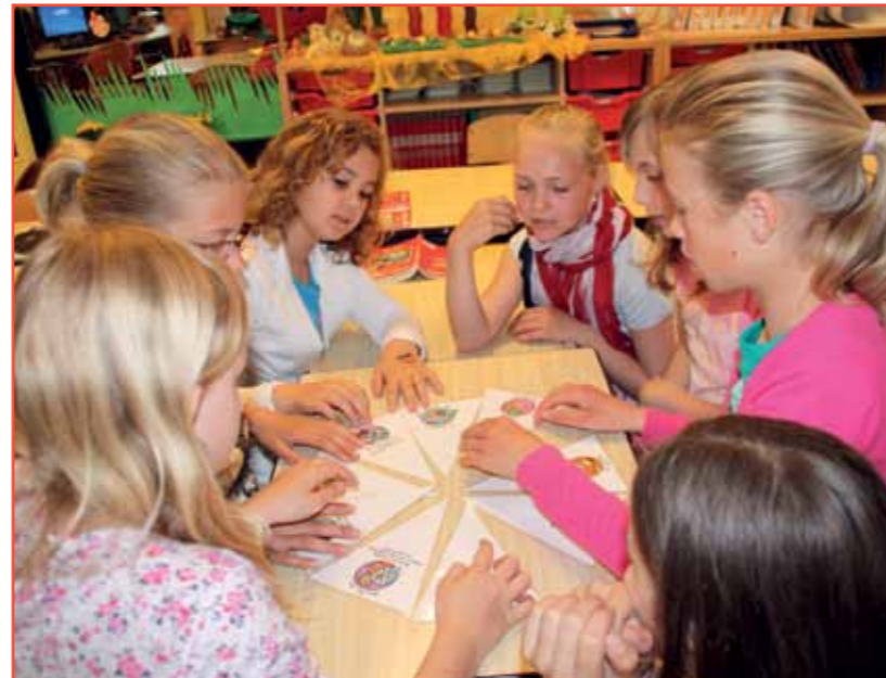
Nadenken over de rechten van het kind...

Thema's zijn bijvoorbeeld: vertrouwen hebben, omgaan met elkaar, vrede, vriendschap, zorgen voor elkaar, delen met elkaar, omgaan met conflicten, respect en omgaan met de natuur.