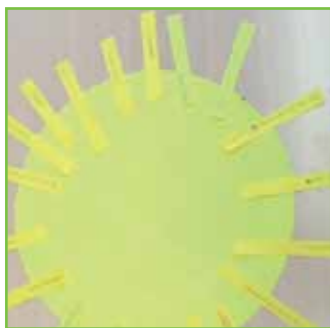
Herinneringszon (één van de opdrachten)

Leerlingen op het Hoeksch Lyceum in Oud-Beijerland die te maken krijgen met het overlijden van een dierbare kunnen op school terecht bij de ondersteuningsgroep 'Gedeeld Verdriet Jongeren'. Deze groep is bedoeld om leerlingen, die iemand verloren hebben, met elkaar in contact te brengen en wordt geleid door twee speciaal hiervoor getrainde begeleiders. Met maximaal acht leerlingen wordt groepsgewijs gewerkt aan opdrachten. Er wordt goed naar elkaar geluisterd en de leerlingen raken met elkaar in gesprek. De bijeenkomsten vinden plaats in een informele setting op school (niet in een klaslokaal). De begeleiders bieden de leerlingen een optimale mogelijkheid om zich te