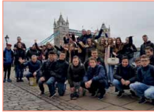
Ook de 62 leerlingen die naar Londen zijn geweest, hadden de tijd van hun leven

Elk jaar organiseert het Actief College in Oud-Beijerland een reis naar Londen voor alle derdeklassers. Voor het eerst stond dit jaar ook een vierdaagse reis naar Berlijn op het programma.