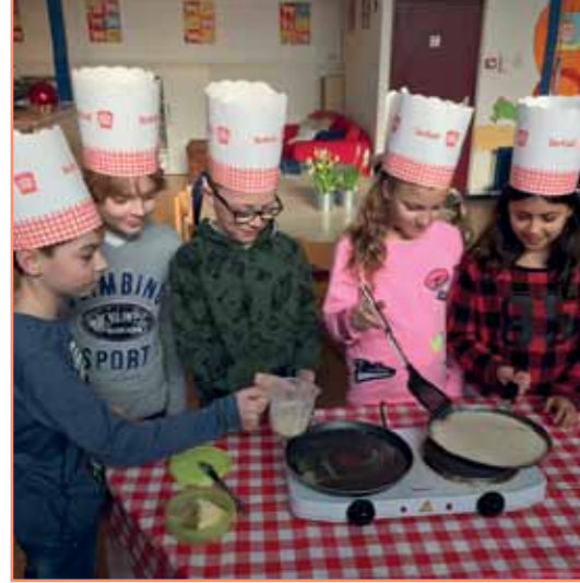
Tijdens de open dag op De Pijler in Maasdam kregen bezoekers een pannenkoek, gebakken door leerlingen van groep 6